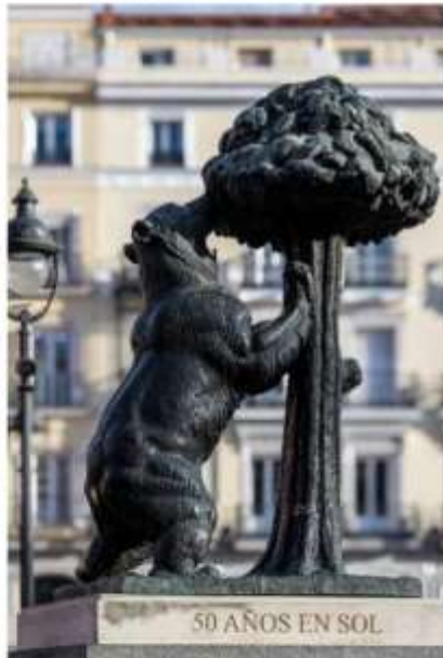
50 AÑOS EN SOL