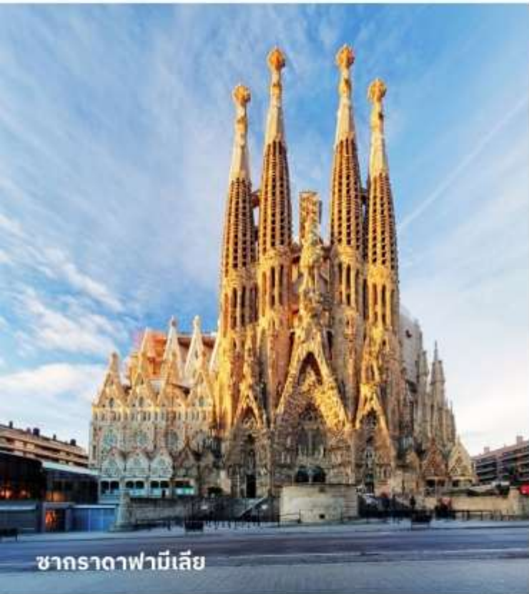
ซากرادาฟามีเลีย