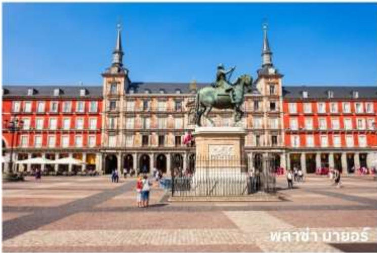
พลาซ่า มายอร์

จากนั้นนำท่านเดินทางสู่ กรุงมาดริด (Madrid) เมืองหลวงของประเทศสเปน ตั้งอยู่ใจกลางแหลมไอบีเรีย ในระดับความสูง 650 เมตร เป็นมหานครอันทันสมัยล้ำยุคที่กษัตริย์ฟิลลิปที่ 2 ได้ทรงย้ายที่ประทับจากเมืองโทเลโดมาที่นี้และประกาศให้มาดริดเป็นเมืองหลวงใหม่ ยกเว้นในช่วงประมาณปี ค.ศ. 1601-1607 เมื่อพระเจ้าฟิลลิปที่ 3 ได้ย้ายเมืองหลวงไปที่เมืองวัลลาโดลิด มาดริดได้ชื่อว่าเป็นเมืองหลวงที่สวยงามที่สุดแห่งหนึ่งในโลกและสูงสุดแห่งหนึ่งในยุโรป จากนั้นผ่านชม น้ำพุไซเบเลส (Cibeles Fountain) ที่สร้างอุทิศให้แก่เทพธิดาไซเบลิน เป็นสถานที่ที่ใช้ในการเฉลิมฉลองในเทศกาลต่างๆของเมือง และนำท่านเดินทางสู่ พลาซ่า มายอร์ (Plaza Mayor) ใกล้เคียง เขตปูเอตาเดลซอล หรือประตูพระอาทิตย์ ซึ่งเป็นจุดศูนย์กลางเมือง นับเป็นจุดนัดภักโกลเมตรแรกของสเปน (กิโลเมตรที่ศูนย์) และยังเป็นศูนย์กลางรถไฟใต้ดินและรถเมล์ทุกสาย นอกจากนี้ยังเป็นจุดตัดของถนนสายสำคัญของเมืองที่หนาแน่นด้วยร้านค้าและห้างสรรพสินค้าใหญ่มากมาย