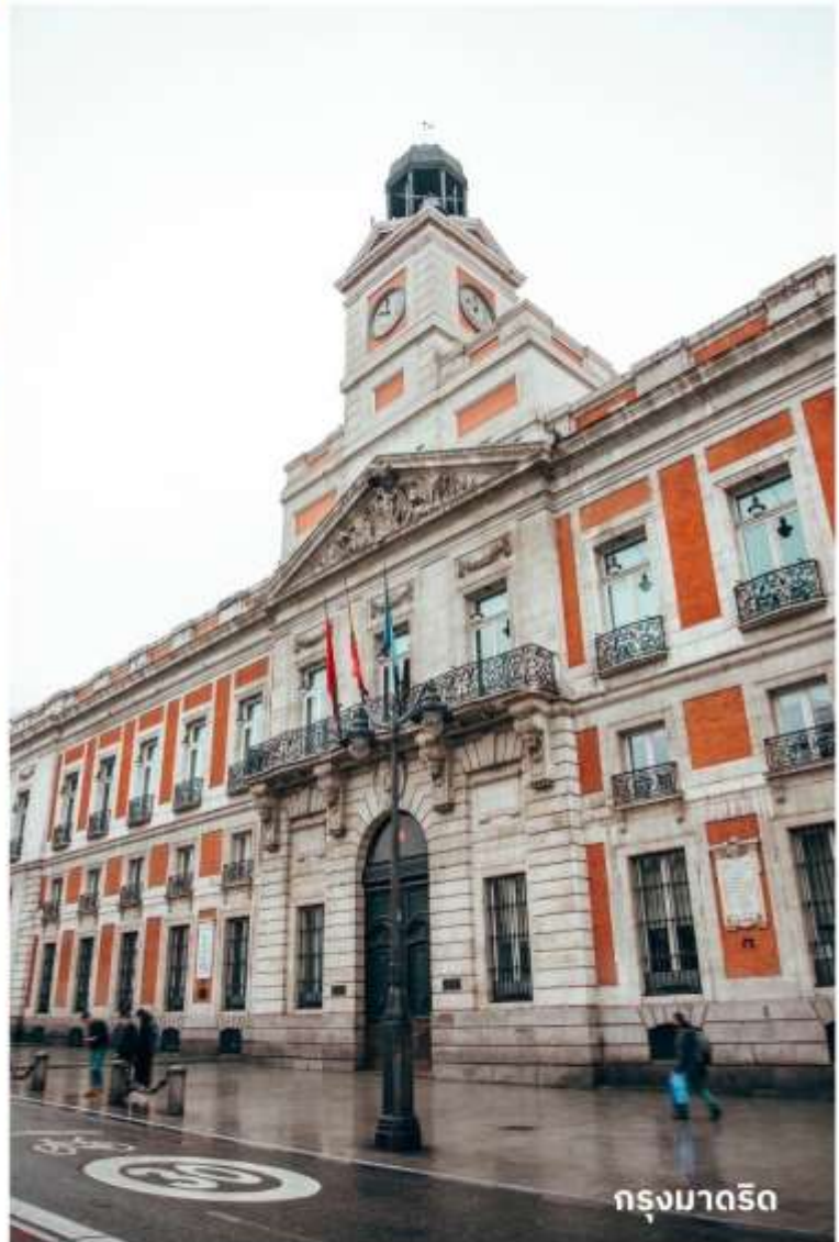
กรุงมาดริด