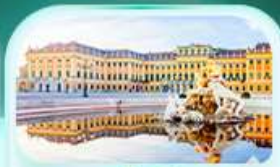
พระราชวังเชินบรุนน์