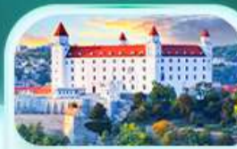
ปราสาทบราติสลาวา

เที่ยวชมเมืองอัลสส์ดัทท์ หมู่บ้านริมหทะเลสาบสวยที่สุดในโลก พระราชวังเชินบรุนน์ เมืองลินซ์ จิตรกรรมฝาผนังยักษ์ สัมผัสเมืองมรดกโลก เซสท์ ครุมลอฟ เยี่ยมชมปราสาทปราก ถนนทองคำ เช็กอินสถานที่ชื่อดัง! ปราสาทบราติสลาวา ส่องเรือชมความงามแม่น้ำดานูบ แม่น้ำที่ยาวที่สุดในยุโรป ชมความน่าหลงใหลของ ปราสาทบูคาเปสต์ สะพานชาร์ลส์