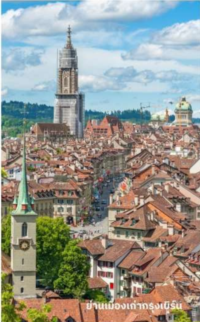
ย่านเมืองเก่ากรุงเบิร์น

นำท่านลัดเลาะชม ถนนจุงเคอร์นกาสเซ ถนนที่มีระดับสูงสุดของเมืองนี้ ซึ่งเต็มไปด้วยร้าน ภาพวาดและร้านขายของเก่าในอาคารโบราณ