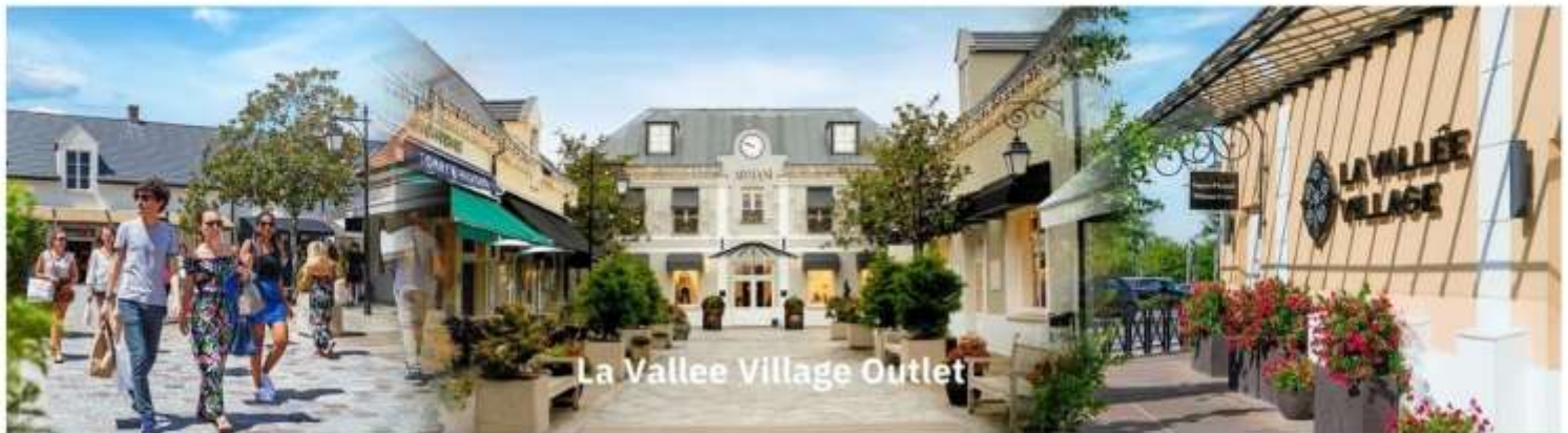
La Vallee Village Outlet