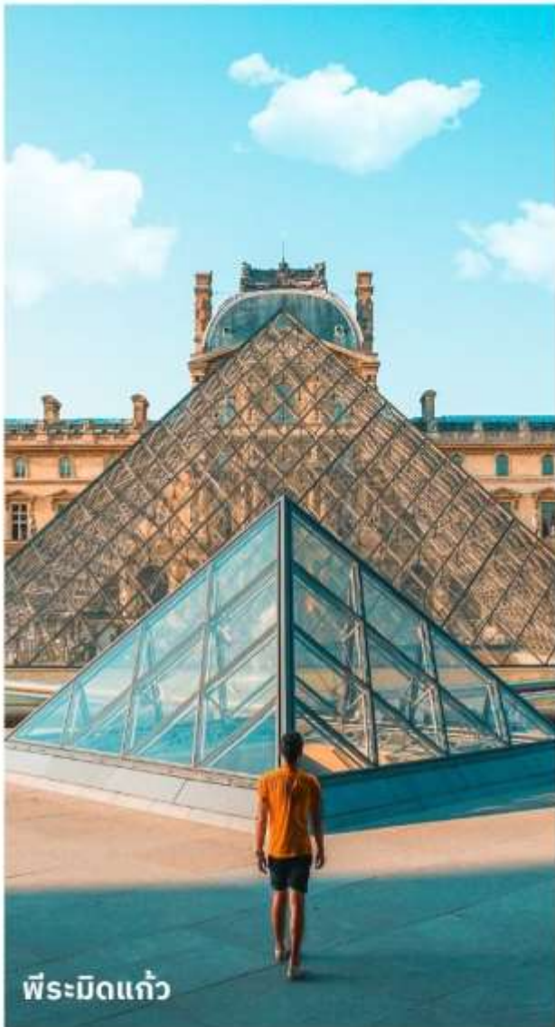
พีระมิดแก้ว

เดินทางสู่ พิพิธภัณฑ์ลูฟร์ ให้ท่านได้ถ่ายรูปด้านหน้า พีระมิดแก้วของพิพิธภัณฑ์ลูฟร์ เป็นพิพิธภัณฑ์ทางศิลปะที่มีชื่อเสียงที่สุด เก่าแก่ที่สุดและใหญ่ที่สุดแห่งหนึ่งของโลก