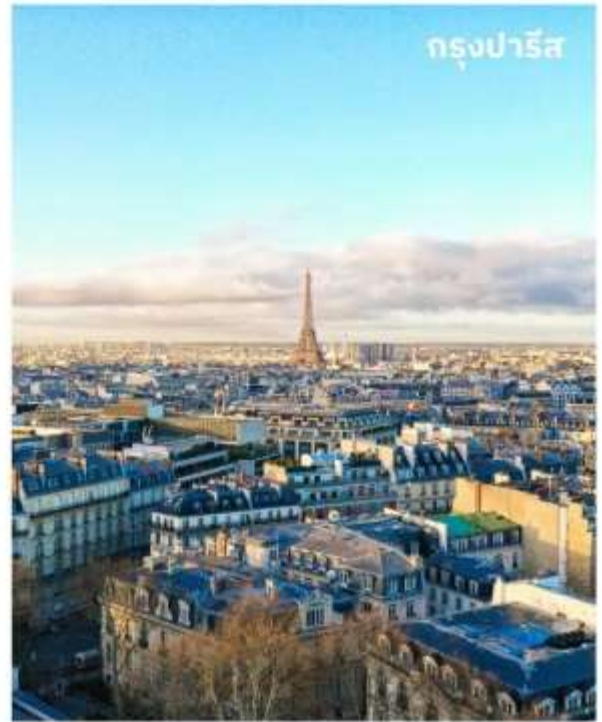
กรุงปารีส

บริการอาหารเช้า ณ ห้องอาหารของโรงแรม หลังจากนั้นนำท่านเดินทางสู่ La Vallee Village Outlet ใช้เวลาเดินทางประมาณ 1 ชั่วโมง แหล่งช้อปปิ้งที่รวมร้านค้าแบรนด์เนมดังมากมาย กว่า 70 ร้าน สัมผัสประสบการณ์การช้อปปิ้งที่ ครบครันด้วยสินค้าชั้นนำต่าง ๆ มากมาย เช่น CELINE, KENZO, LONGCHAMP, POLO, BLANC BLEU, FRANCOIS, DIESEL GIRBAUD, PAUL SMITH, BURBERRY, VALENTINO, VERSACE, KEVIN KLEIN, SAMSONITE, ARMANI, CERRUTI, DOLCE & GABBANA, GIVENCHY ฯลฯ