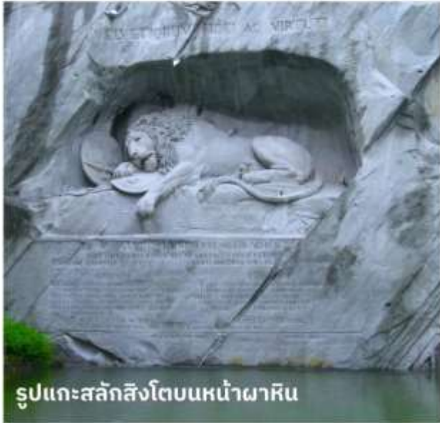
รูปแกะสลักสิงโตบนหน้าผาหิน

จากนั้นนำท่านเดินทางสู่ เมืองแองเกลเบิร์ก เพื่อนั่งกระเช้าหิมะแห่งแรกของโลกสู่ ยอดเขาคัทลิส (TITLIS) แหล่งเล่นสกีของสวิตเซอร์แลนด์ภาคกลาง ที่หิมะคลุมตลอดทั้งปี สูงถึง 10,000 ฟุต หรือ 3,020 เมตร บนยอดเขาแห่งนี้หิมะจะไม่ละลายตลอดทั้งปี นั่งกระเช้ายักษ์ที่หิมะได้รอบทิศเครื่องแรกของโลกที่ชื่อว่า REVOLVING ROTAIR จนถึงสถานีบนยอดเขาคัทลิส