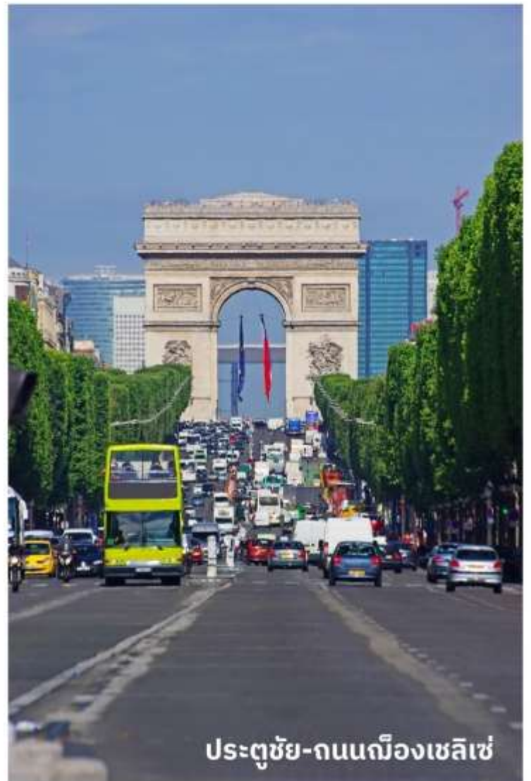
ประตูชัย-ถนนฌ็องเซลิเซ่

จากนั้นนำท่านเดินทางท่องเที่ยวตามสถานที่ ที่มีชื่อเสียงของกรุงปารีส