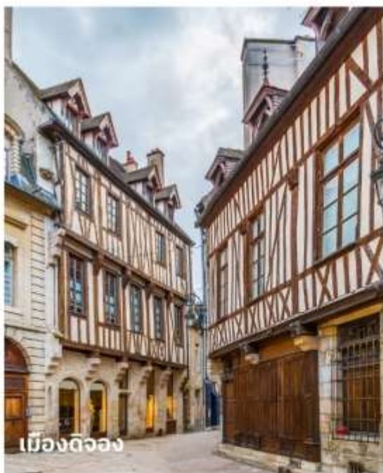
เมืองดิจอง