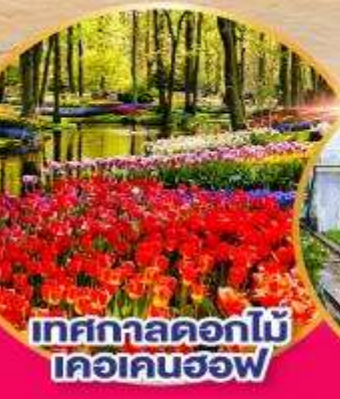
เทศกาลดอกไม้ เคอเคนฮอฟ