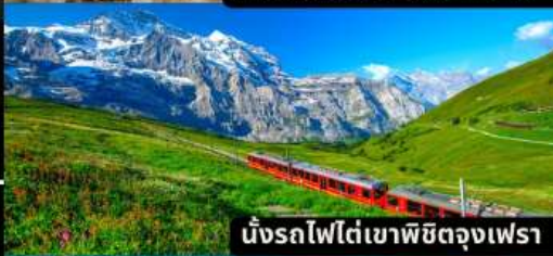
นั่งรถไฟใต้เขาพิชิตดงเฟรา