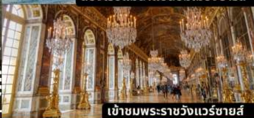
เข้าชมพระราชวังแวร์ซายส์