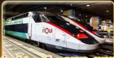
นั่งรถไฟความเร็วสูง PARIS - LYON