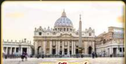
เซนต์ปีเตอร์