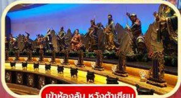
เข้าห้องลับ หวังต้าเซียน