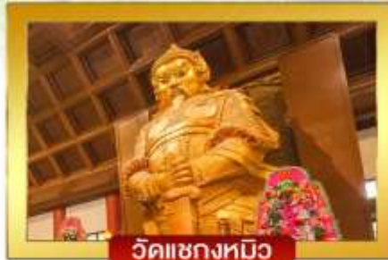
วัดแซงกหมิว