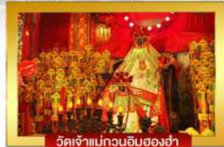
วัดเจ้าแม่กวนอิมฮองฮ่า