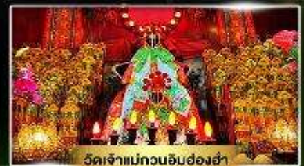
วัดเจ้าแม่กวนอิมฮ่องฮ่า