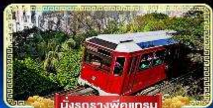
นิงรถรางพิกเกรม

🇧🇪 นิงกระเช้ามองปิง 360 องศา บินลัดฟ้าไปมู..สู่เกาะฮ่องกง