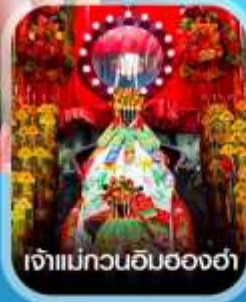
เจ้าแม่ทวนอิมฮ่องกง

1-3 มีนาคม 2568 8-10 มีนาคม 2568 22-24 มีนาคม 2568