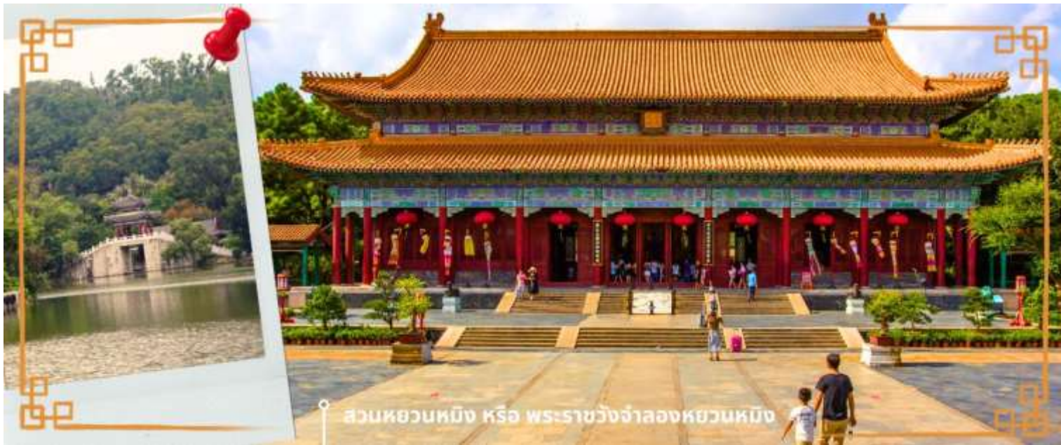
สวนหยวนหมิง หรือ พระราชวังจำลองหยวนหมิง

จากนั้นนำท่านสู่ สวนหยวนหมิง หรือ พระราชวังจำลองหยวนหมิง ตั้งอยู่ ณ ใจกลางหุบเขาซีลิน เมืองจูไห่ สร้างขึ้นเลียนแบบพระราชวังหยวนหมิง ณ กรุงปักกิ่ง สิ่งก่อสร้างต่างๆ มากกว่า 100 ชั้น มีขนาดเท่าของจริงในอดีตทุกชั้น อาทิ เสาหินคู่ สะพานข้ามธารทอง ประตูต่างง ตำหนักเจิ้งต้ากวางหมิง สะพานเก้าเหลี่ยม สวนแห่งนี้โอบล้อมด้วยขุนเขาที่เขียวชอุ่ม และมีพื้นที่ครอบคลุมทะเลสาบขนาดมหึมา ซึ่งมีขนาดเท่ากับสวนเดิมในกรุงปักกิ่ง และยังมีการเพิ่มเติมและตกแต่ง