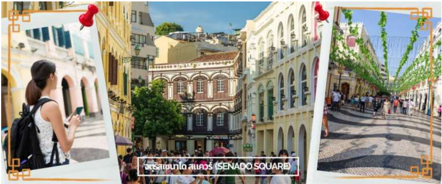
จตุรัสเซนาโด สแควร์ (SENADO SQUARE)

จากนั้นนำท่านเดินทางสู่ อนุสรณ์สถาน ดร.ซุนยัตเซ็น (Dr. Sun Yat-Sen Memorial Hall) ที่สร้างขึ้นเพื่อรำลึกถึง ดร. ซุนยัตเซ็น ซึ่งถือว่าเป็นบิดาของชาวจีน เป็นผู้ปลดปล่อยชาวจีนจากระบอบสมบูรณาญาสิทธิราชย์ ที่ปกครองประเทศจีน มาเป็นเวลาหลายพันปี โดยบ้านเกิดของเขานั้นก็อยู่ที่ เมืองเซียงซัน ในกว่างเจา ภายในอนุสรณ์สถานนั้น เป็นหอประชุม ขนาดใหญ่รูปทรงแปดเหลี่ยม ที่ได้รับการยกย่องว่าเป็นสถาปัตยกรรมชิ้นเยี่ยม เพราะสร้างขึ้นโดยไม่มีเสากลางห้องที่จะบด บังสายตาของผู้ชมที่มองไปยังเวที ภายในหอประชุมนั้น มีประวัติของ ดร.ซุนยัตเซ็นได้ให้อ่านกัน และบริเวณด้านหน้า หอประชุมก็มีอนุสาวรีย์ของ ดร.ซุนยัตเซ็น ยืนเด่นเป็นสง่า เป็นจุดที่นักท่องเที่ยวทุกคนจะต้องเก็บรูปไปเป็นที่ระลึกอีกทั้ง บริเวณรอบๆหอประชุมยังจัดทำเป็นสวนสาธารณะให้ประชาชนเข้ามาพักผ่อนหย่อนใจกัน