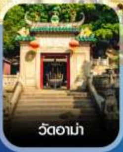
วัดอาน่า

✈️ คอนเฟิร์มออกเดินทาง ✈️ ทุกพีเรียด 2ท่านขึ้นไป