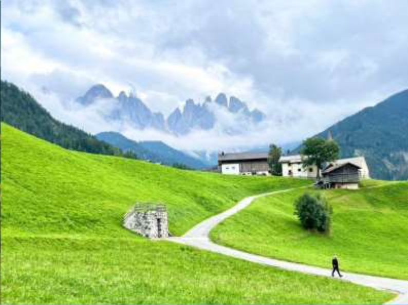
Santa Maddalena - Val di Funes