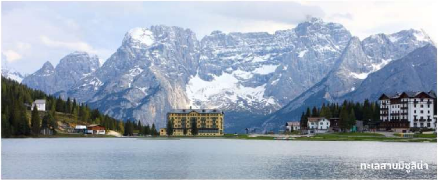
ทะเลสาบมิซูลิน่า

นำท่านเดินทางสู่ที่ ทะเลสาบมิซูลิน่า (MISURINA LAKE) ถ่ายรูปกับทะเลสาบที่สวยงามและเป็นเหมือนกับหนึ่งในแลนด์มาร์คที่นักท่องเที่ยวต้องมาเยือนสักครั้งหนึ่ง เป็นทะเลสาบที่หลบซ่อนตัวในหุบเขา ที่ถือเป็นสถานที่ท่องเที่ยวที่สำคัญอีกแห่งในโดโลไมท์