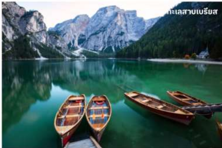
ทะเลสาบเบรียส