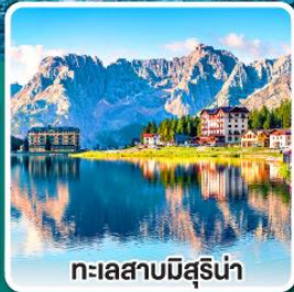
ทะเลสาบมิสุรีน่า