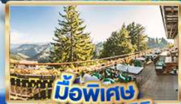
มือพิเศษ บียอดเวนิซีกี