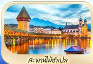
สะพานไมซ์ฮาเปล