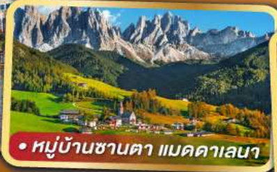
• หมู่บ้านซานตา แมดดาเลนา