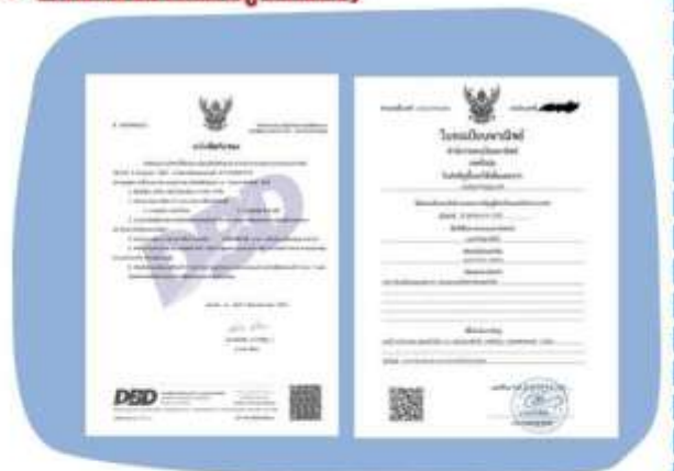
ตัวอย่างหนังสือจดทะเบียนบริษัทฯ และ ใบทะเบียนพาณิชย์