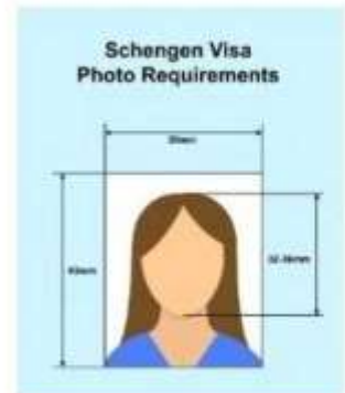
ตัวอย่างรูปถ่าย