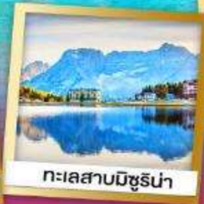
ทะเลสาบมิชูร์น่า