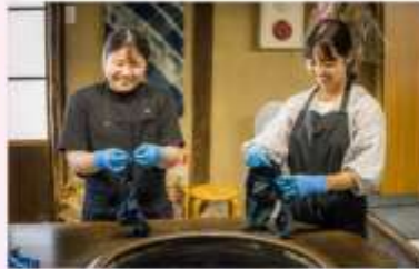
MAKE INDIGO DRING