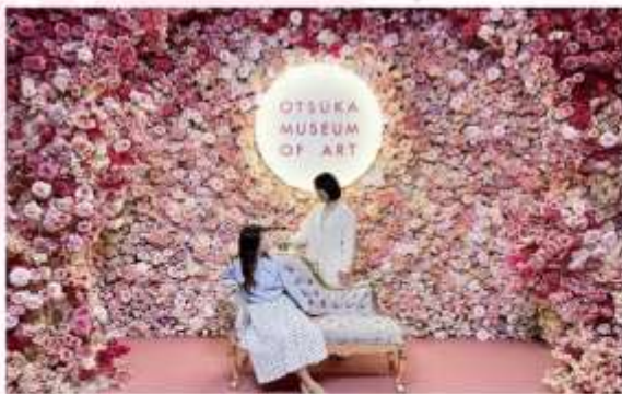
OTSUKA MUSEUM OF ART