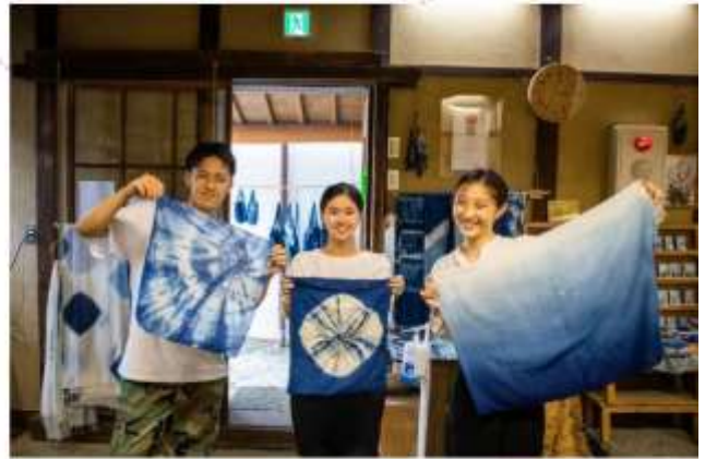
รับประทานอาหารกลางวัน ณ กัตตาคาร