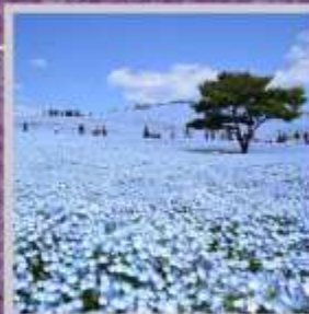
"HITACHI SEASIDE PARK"