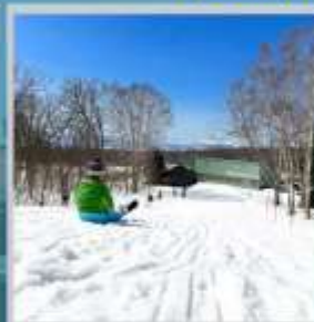
"NISEKO SKI RESORT"