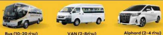
Bus (10-20 ท่าน) VAN (2-8ท่าน) Alphard (2-4 ท่าน)