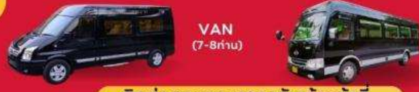
VAN (7-8ท่าน) BUS (10-18 ท่าน)