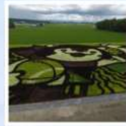
ศิลปะบนนาข้าว