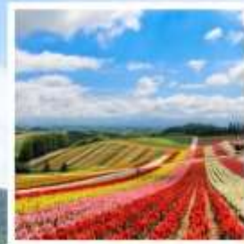
สวนดอกไม้ชิชิโกะโนะโอกะ