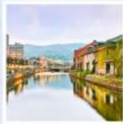
เมืองโอตารุ