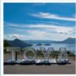
จุดชมวิวจิโงโตะ

ชมวิวที่สวยงามที่สุดบนทะเลสาบโทโยะ ณ จุดชมวิวจิโงโตะ เมืองสุดแสนโรแมนติก กับถนนสายของหวานชื่อดัง โอตารุ ศิลปะบนนาข้าว เรืองราวในทุ่งนาสะท้อนจิตวิญญาณแห่งฮอกไกโด ที่ 1 ปี มีครั้งเดียว กิน กิน และ กิน จูใจไปกับเมล่อนเขียนจำแบบไม่ฉิ่ง ชมฟาร์มโคนมชื่อดัง นิเซโกะ ทาคาฮาชิ กับวิวโยเทแสนพิเศษ สวนดอกไม้กับวิวเทือกเขาที่โด่งดังที่สุดแห่งฮอกไกโด ณ สวนชิชิโกะโนะโอกะ พักออนเซ็น 1 คืน!!! พักในเมืองชิปปุโร 2 คืน เมบูพิเศษ...บุฟเฟ่ต์เมล่อน, บุฟเฟ่ต์ซาปู, บุฟเฟ่ต์ซาบู, บุฟเฟ่ต์บิงย่าง กรุ๊ปสบายๆ เพียง 20 ท่านเท่านั้น!!!