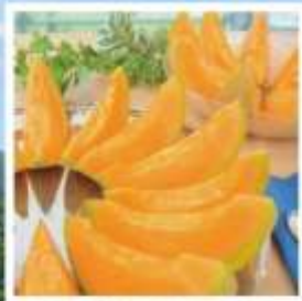
ศูนย์จำหน่ายเมล่อนยูบาริ