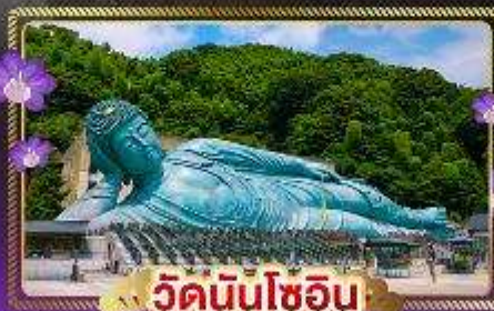
วัดนินโซอิน