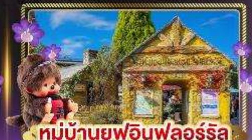
หมู่บ้านยูฟูอินฟลอร์ริล