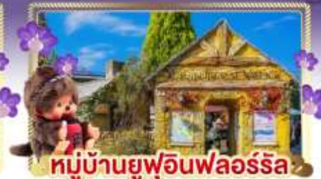
หมู่บ้านยูฟูอินฟลอร์ริล