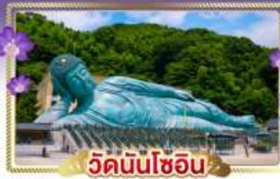
วัดนันโซอิน