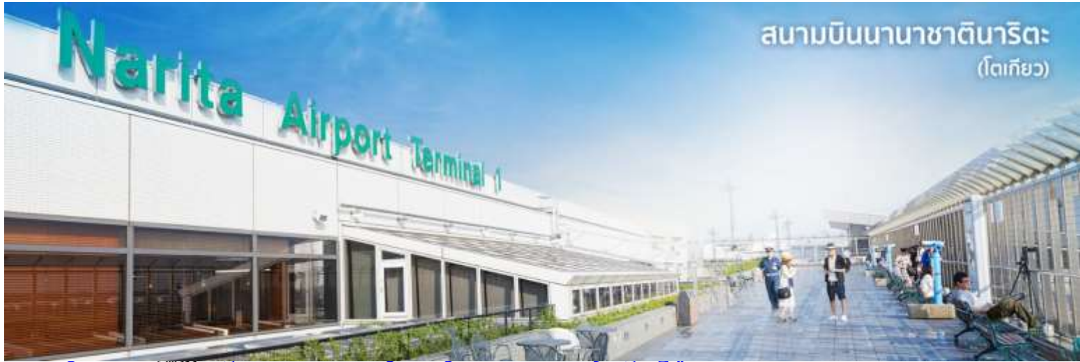
สนามบินนานาชาตินาริตะ (โตเกียว)

10.55 น. เดินทางถึง ท่าอากาศยานนานาชาตินาริตะ ประเทศญี่ปุ่น (เวลาที่ประเทศญี่ปุ่นจะเร็วกว่าประเทศไทย 2 ชม. ควรปรับนาฬิกาของท่านเพื่อสะดวกในการนัดหมาย) นำท่านผ่านขั้นตอนการตรวจคนเข้าเมืองและศุลกากร พร้อม ตรวจเช็คสัมภาระ เรียบร้อยแล้ว สำคัญมาก!! ประเทศญี่ปุ่นไม่อนุญาตให้นำอาหารสด เนื้อสัตว์ พืช ผัก ผลไม้ เข้าประเทศ หากฝ่าฝืนมีโทษปรับและจับ