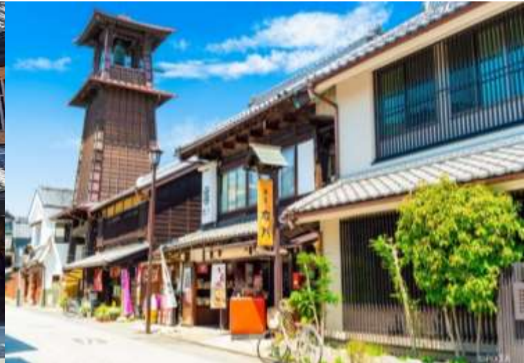
หน้าทางเดินเท้าทางสู่ “เมืองคาวาเกะเอะ” บนเมืองเล็ก ๆ ใน

จังหวัดไซตามะ เป็นหนึ่งในสถานที่ท่องเที่ยวที่มีเสน่ห์มากที่สุดในแถบชานเมืองโตเกียว เป็นสถานที่ที่เหมาะสมสำหรับสัมผัสกับบรรยากาศญี่ปุ่นแบบดั้งเดิม ซึ่งมีทั้งสถาปัตยกรรมเก่าแก่ และวัฒนธรรมท้องถิ่นที่สามารถย้อนรอยไปในยุคเอโดะได้อย่างแท้จริง เป็นสถานที่ท่องเที่ยวที่ไม่ควรพลาดสำหรับคนที่ต้องการหลีกเลี่ยงความวุ่นวายของเมืองใหญ่และสัมผัสกับบรรยากาศแบบญี่ปุ่นดั้งเดิม