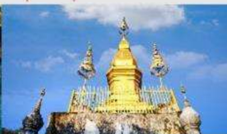
พระธาตุพูสี

*ทางบริษัทฯ ขอสงวนสิทธิ์ในการสลับโปรแกรมทัวร์ตามความเหมาะสมขึ้นอยู่กับสถานการณ์หน้างาน โดยคำนึงถึงผลประโยชน์ของลูกค้าเป็นสำคัญ