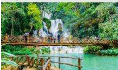
น้ำตกตาดกว้างสี