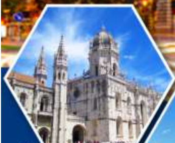
มหาวิหารเจอโรนิโม