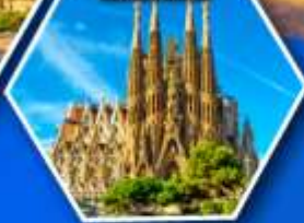
โบสถ์ซากราดา แฟมิเลีย