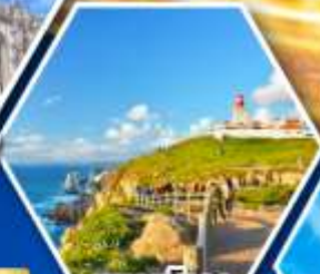
แหลมโรกา