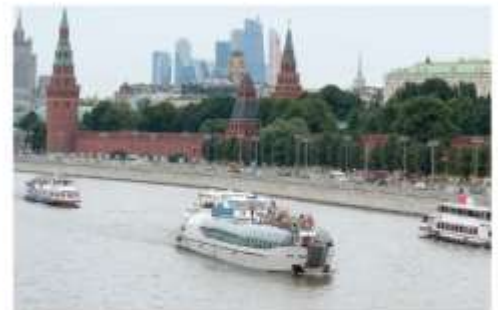
ล่องเรือแม่น้ำมอสโคว์