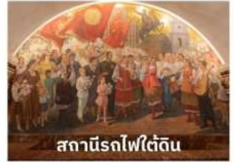
สถานีรถไฟใต้ดิน

เพราะนอกจากจะมีสถานีรถไฟใต้ดินที่สวยงามที่สุดในโลกแล้วยังมีความลึกมากอีกด้วย รถไฟใต้ดินทำให้ผู้คนสามารถเดินทางไปไหนมาไหนได้สะดวกกว่าบนถนนทั่วไป สถานีรถไฟใต้ดินเป็นสิ่งก่อสร้างที่ชาวรัสเซียสามารถอวดชาวต่างชาติให้เห็นถึงความยิ่งใหญ่ ตลอดจนประวัติศาสตร์ความเป็นชาตินิยมและวัฒนธรรมประเพณีอันสวยงาม เป็นเสน่ห์ดึงดูดให้นักท่องเที่ยวมาเยี่ยมชมเนื่องจากการตกแต่งของแต่ละสถานี มีความแตกต่างกันด้วยประติมากรรม โคมไฟระย้า เครื่องแก้ว หินแกรนิต และหินอ่อน เป็นต้น