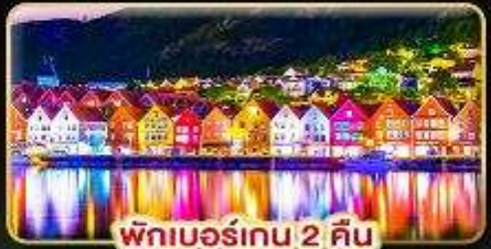
พักเบอร์เกน 2 คีน