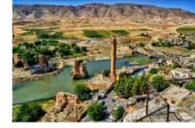
เมืองฮาซันคีฟ