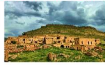
เมืองดารา