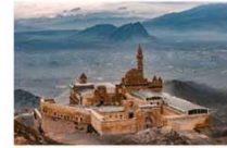
พระราชวังอิซฮาก พาชาร์