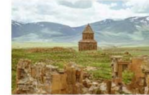
เมืองเอนิชม

15.25-17.50 น. เห็นฟ้ากลับสู่อิสตันบูล โดยสายการบิน TURKISH AIRLINES เที่ยวบินที่ TK 2717 (บินภายในประเทศ)