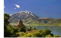
เมืองวาน