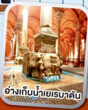
อ่างเก็บน้ำเยเรบาตัน