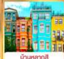
บ้านหลากสี คิสเลอร์ฟู