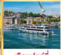
เรือเฟอร์รี่