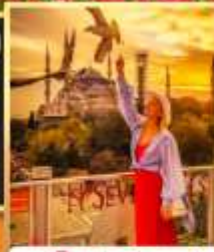
สุฟทือปเซเวนฮิลล์ส