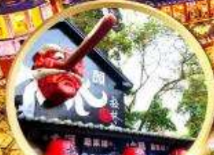
หมู่บ้านปิตาจชไต