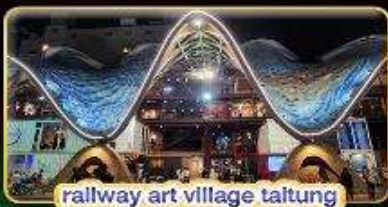
railway art village taitung

ชมเมืองธรรมชาติ จุดเช็คอินใหม่ 3 เมือง ช้อปปิ้งจุใจ.. ตลาดกลางคืนที่ใหญ่ที่สุดในเมืองเกาสง