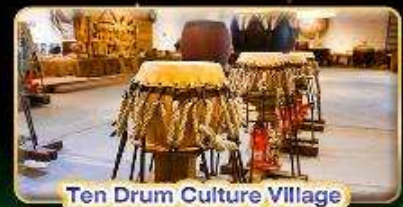
Ten Drum Culture Village