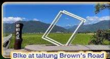
Bike at taitung Brown's Road