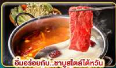
อิ่มอร่อยกับ..ชาบูสไตล์ไต้หวัน เมนูหม้อไฟจิ๋วพรีเมียม เสียวทงเป่า