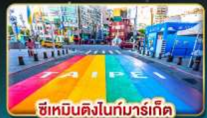
ซีเหมินติงไนท์มาร์เก็ต