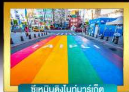
ซีเหมินดิงไนกั่มาร์เก็ท