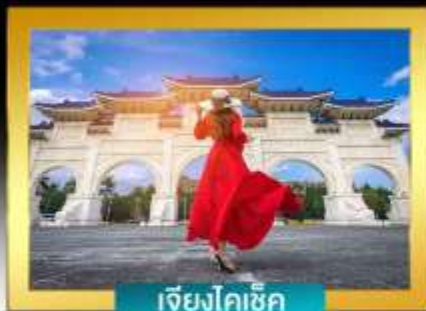
เจียงโคซึก