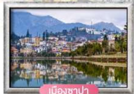
เมืองซาปา