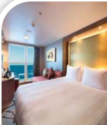
Oceanview Stateroom with Balcony